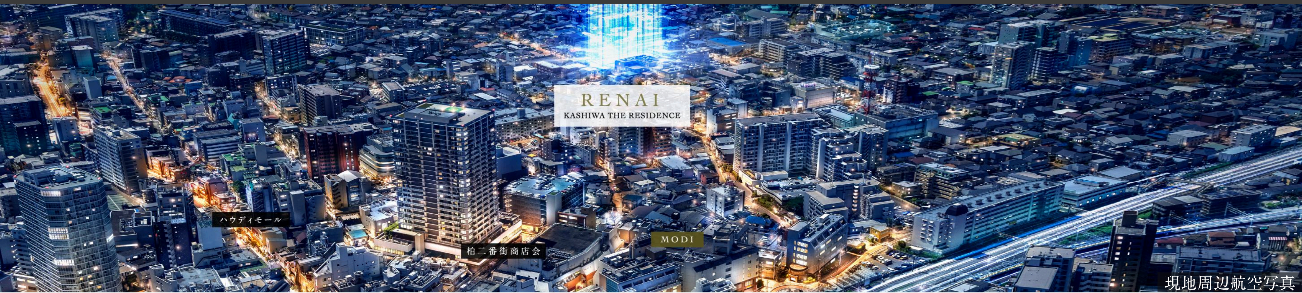
現地周辺航空写真

利便の特等席と、落ち着きある住環境を両立した新生活のストーリー。 単なる「駅近」ではなく、暮らしの質を高める絶妙なロケーションが、多くのご契約者様に支持されました。